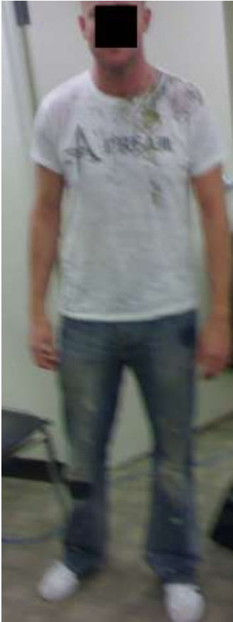
这是白天穿的稳中求好的衣着。