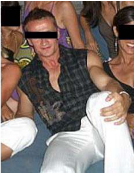
都市美型男性感套路