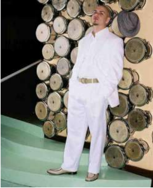
拉丁情人性感套路