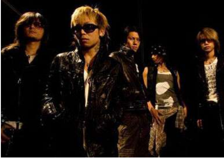
日系摇滚明星性感套路