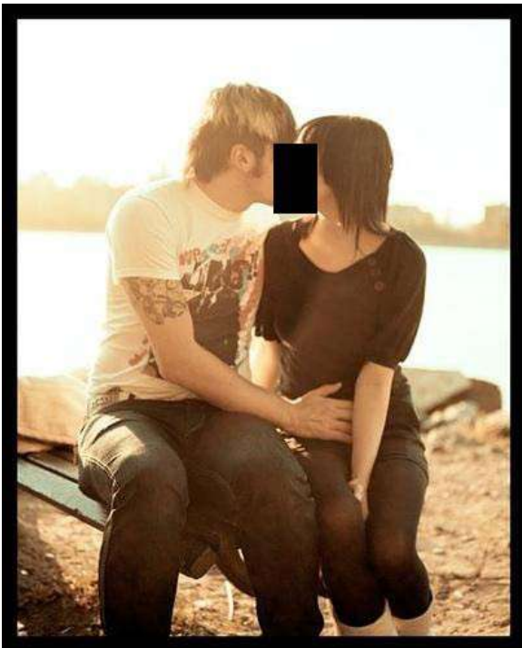
这是白天走性感套路的男人衣着。