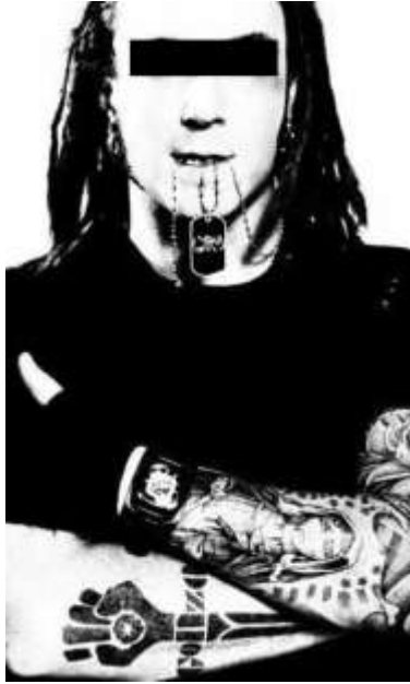
“骇人”长辮发型性感套路